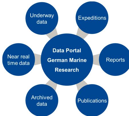
Abbildung 3: Inhalte des „Datenportals Deutsche Meeresforschung“.

Bislang wurden die folgenden Suchfunktionen im Datenportal implementiert: