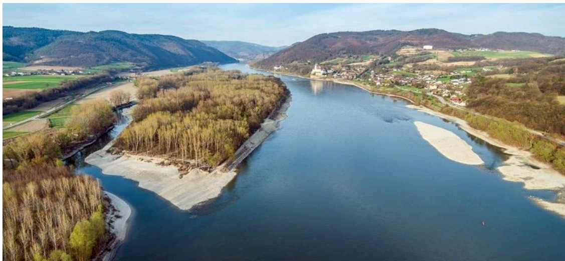
Bild 1: Die Wachau ist UNESCO Weltkulturerbe, Natura 2000 FFH- und Vogelschutzgebiet sowie Landschaftsschutzgebiet. Zur Verbesserung des ökologischen Zustandes werden Gewässervernetzungen - im Bild Schallemmersdorf, Teil des Best LIFE Nature Projekts 2015 „Mostviertel-Wachau“ - und Kiesstrukturen geschaffen.

Trotz ihres frei fließenden Charakters verfehlt der Donauabschnitt jedoch den guten Zustand laut EU Wasserrahmenrichtlinie (WRRL), denn das KO- Kriterium der Fisch-Biomasse von mindestens 50 kg/ha wird unterschritten. Durch eine Reihe von LIFE Projekten hat viadonau zahlreiche Nebenarme wieder verstärkt mit der Donau verbunden und - auch mit dem Aushub der Erhaltungsbaggerungen - Kiesstrukturen geschaffen. Mit dem LIFE Projekt „Auenwildnis Wachau“ befindet sich derzeit ein weiteres Renaturierungsprojekt in Umsetzung. Der Fischbestand erholt sich langsam und der Populationsaufbau der wesentlichen Leitarten entwickelt sich in Richtung des natürlichen Zustands. Ob die Anstrengungen ausreichen, um - wie nach der WRRL gefordert - bis 2021 die Biomasse über den Schwellenwert anwachsen zu lassen, bleibt abzuwarten.