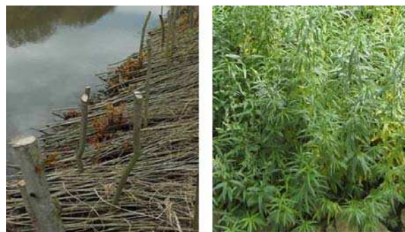
Bild 5: Weidenspreitlagen: Einbauzustand/ Zustand nach etwa 3 Monaten

Weidenspreitlagen sind pflanzliche Ufersicherungen, bestehend aus austriebsfähigen Weidenruten, die meistens quer zur Fließrichtung flächig eng nebeneinander liegend auf der Uferböschung verlegt und mit Pflöcken und horizontalen Querriegeln oder Drahtverspannungen sicher am Boden befestigt werden. Wichtig ist, dass dabei keine Lücken bleiben, in denen der dort anstehende Boden bei hydraulischer Belastung nicht geschützt wäre. Die basalen Enden der Weidenäste müssen so angeordnet werden, dass sie ausreichend mit Wasser versorgt sind. Als Fußsicherung bietet sich eine Einbindung der Rutenenden in die in der Regel unter Wasser befindliche Steinschüttung an. Ist keine Steinschüttung vorhanden, muss der Fußbereich der Weiden durch Längsfaschinen oder andere alternative Maßnahmen gesichert werden. Durch Austreiben der Ruten erfolgt eine zunehmende Verwurzelung mit dem Untergrund. Langfristig ist das Ufer durch sich entwickelnde Gehölze gesichert. Eine planmäßige Unterhaltung ist aus den oben beschriebenen Gründen erforderlich. Die Material- und Herstellungskosten für die Ufersicherung sind vergleichsweise gering.