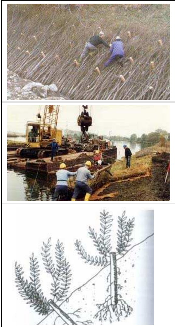
Bild 3: Flächig wirkende Ufersicherungen - oben: Spreitlagen, Mitte: Kammerdeckwerke; Punktuell wirkende Ufersicherungen - unten: Steckhölzer

onsstabil ist. Der Boden wird in diesem Fall um die punktuellen und linearen Sicherungen erodiert. Langfristig wird dadurch auch die über die Wurzel vorhandene Verankerung der Einzelpflanze im Boden geschwächt, so dass diese nicht dauerhaft stabil erhalten bleiben kann.