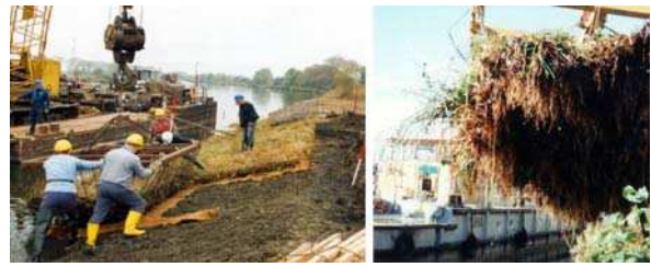
Bild 6: Kammerdeckwerk: Einbauzustand/ Zustand nach 4 Jahren (Deckwerksaufnahme)

Aus Erfahrungen an kleineren Fließgewässern ist bekannt, dass Kammerdeckwerke bei entsprechender konstruktiver Ausbildung langfristig Schubspannungen von 100 bis 150 N/m 2 /Begemann, Schiechl, 1994/ aufnehmen können. Das heißt, die Belastbarkeit ist relativ hoch. Zulässige Wellenhöhen für Anwendungen an Wasserstraßen liegen noch nicht vor. Aufgrund der technischen Komponenten besitzen diese Ufersicherungen zusätzlich ein gewisses Gewicht, so dass diese auch in Böschungsbereichen, die durch Wasserspiegelsunk belastet werden, eingesetzt werden können (Bild 2, rechts). Voraussetzung ist, dass das Gewicht für die gegebenen hydraulischen Belastungen ausreichend groß ist. Dies ist nach /GBB, 2004/ nachzuweisen.