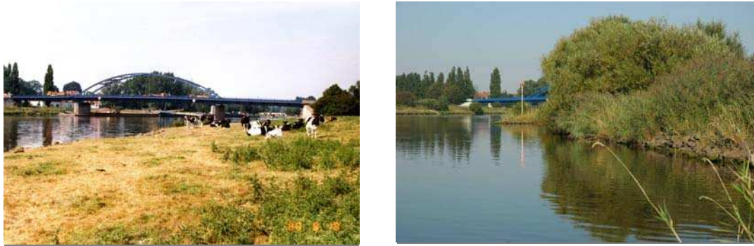
Abb. 1: Versuchsstrecke Stolzenau 1988 und 2006

Abb. 1 zeigt einen Blick auf die Versuchsstrecke vor Einbau der alternativen Ufersicherung (linkes Bild) und zum Vergleich 2006, d.h. etwa 17 Jahre nach Herstellung (rechtes Bild).